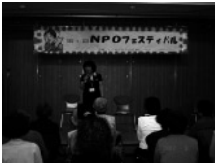
みなさん、運動しましょう！」