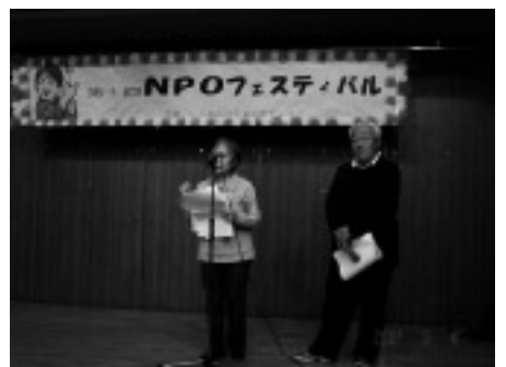
優しさが伝わってきます