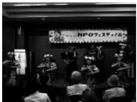
会場にハワイの風が～