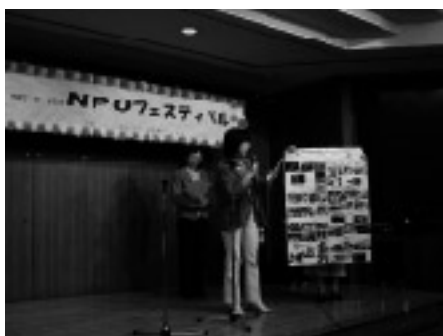
活動内容がよくわかりました