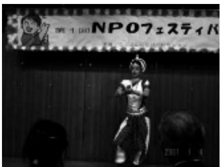
ネパールの民族舞踊にうっとり