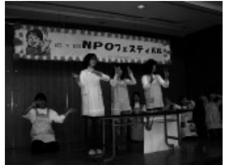
すてきな保育士さんたち