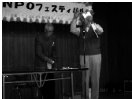
ひこうき上手く飛んだかな？