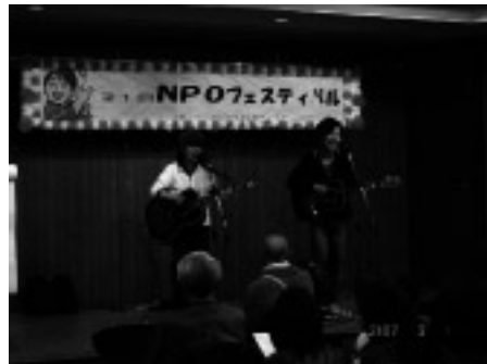
セカハン 癒されるう