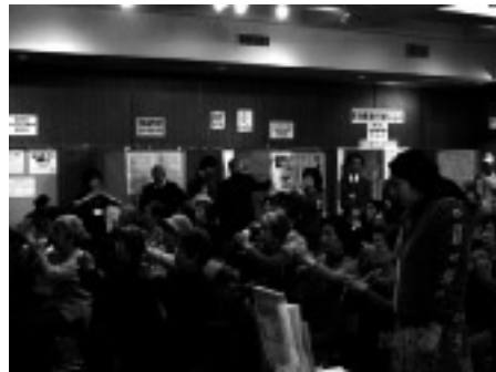
音楽に合わせて心も身体もリフレッシュ!