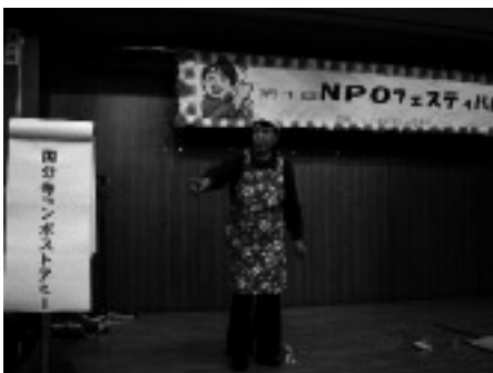
熱演ありがとうございます